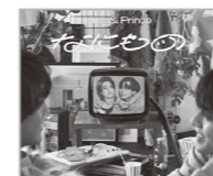
ユニバーサル ミュージック UPCJ-9045 (通常盤)

2人体制となったKing & Princeのシングル第一弾は、メンバーの高橋海人が主演したドラマの主題歌。“気負わず、今を楽しむこと”をテーマとした今作は、日常にある小さな幸せの積み重ねで日々が彩り豊かになっていくという、今のKing & Princeの等身大を歌った飾らない応援歌です。