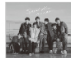
ジェイストーム JACA-6048 (通常盤)

CDデビュー2年目となる、なにわ男子の4枚目のシングルは、メンバー高橋恭平の初単独主演映画の主題歌。片想いのときめきや苦さを歌いながらも、暮る気持ちは両想いへ……。全員20代を迎えたなにわ男子が、ちよっぴり大人びた雰囲気と歌いあげるミディアムバラードのラブソングです。