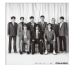
エイベックス・ トラックス JWCD-63861 (通常盤)

作詞：MINE/Atsushi Shimada 作曲：Takuya Harada/MINE/Atsushi Shimada ピアノアレンジ：川田千春