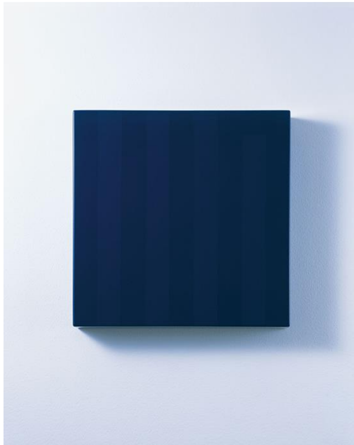
《inside/002》2016年、MDF、ウレタン塗装、33.3 x 33.3 x 5 cm